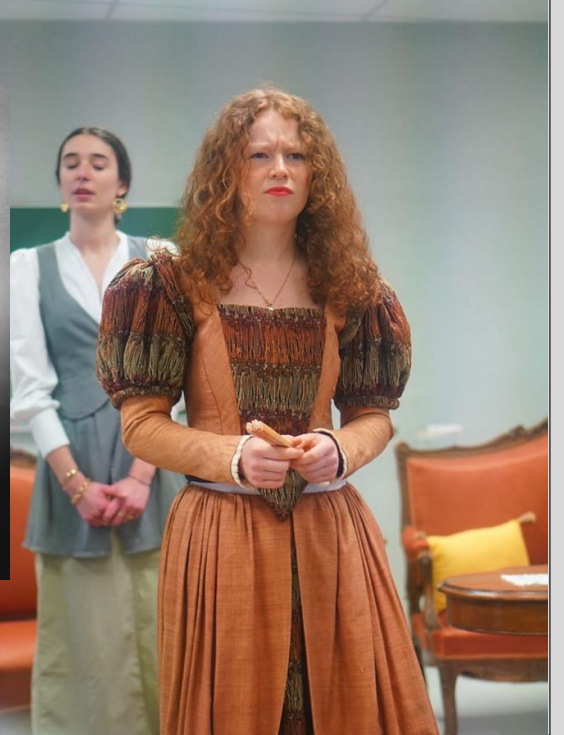
HK, Marivaux, 2024