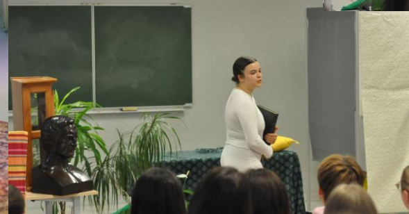
Représentation des khâgnes, Cendrillon de Joël Pommerat, première partie