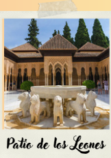
Patio de los Leones

Caminante no hay camino, se hace camino al andar. Al andar se hace el camino, y al volver la vista atrás se ve la senda que nunca se ha de volver a pisar.